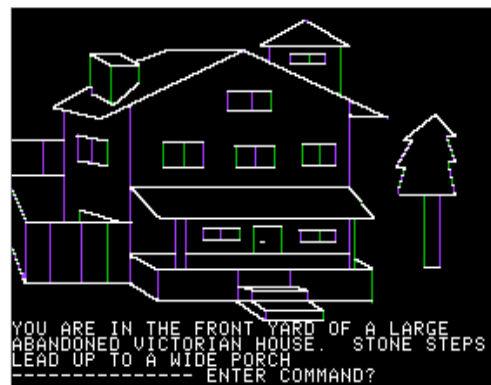
Figura 2. La Mystery House (La Casa Misteriosa) para Apple II, una de las primeras aventura con gráficos al principio de los ordenadores personales ( http://es.wikipedia.org/wiki/Mystery_House , enero 2015).

Actualmente muchas de estas aventuras gráficas se comercializan a través de internet. En la página http://www.telltalegames.com/ se pueden ver varios ejemplos de aventuras gráficas actuales en tres dimensiones. Algunas aventuras gráficas pueden jugarse incluso de forma gratuita a través de internet. En el siguiente enlace se puede probar una aventura gráfica gratuita online: