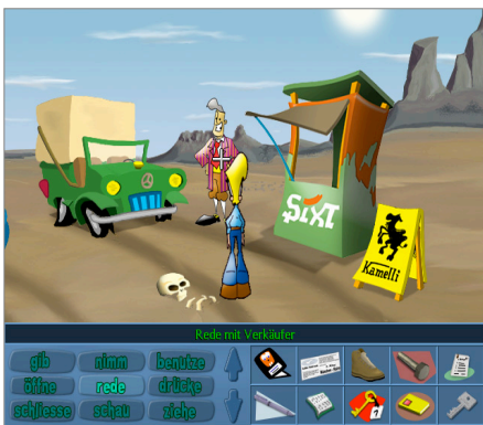
Figura 1. Escena de aventura gráfica en dos dimensiones, mostrando el menú de acciones y objetos. Se trata del juego Patrimonium ( http://www.abandonsocios.org , enero 2015).

La aventura gráfica es un tipo de videojuego cuya dinámica consiste en ir avanzando por el mismo a través de la resolución de diversos rompecabezas . Estos rompecabezas representan situaciones que se suceden en la historia a modo de interacción entre el usuario y los personajes y objetos del juego. Dicha interacción estará definida mediante un menú de acciones o interfaz similar, utilizando un cursor para mover al personaje y realizar las distintas acciones. En los ordenadores actuales la interfaz gráfica de este tipo de juegos está muy cuidada, siendo normal el uso de gráficos tridimensionales para los personajes y el entorno (ver Figura 1). El término videoaventura es más correcto cuando los gráficos dejan de ser estáticos y tanto el movimiento como las acciones de los personajes se pueden visualizar en tiempo real en la pantalla. Sin embargo, hoy en día la mayoría de los juegos de este tipo tienen implementadas esas funciones, por lo que los términos videoaventura y aventura gráfica se usan indistintamente.